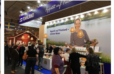
Kuvat Suomen Grüne Woche -osastoilta vuosina 2016 ja 2018.

Suomi on pääyhteistyökumppani 18.-27.1.2019 Berliinissä pidettävillä maailman suurimmilla ruoka-alan kuluttajamessuilla . Suomalainen puhdas arktinen ruoka puhtaasta luonnosta, kestävä suomalainen metsätalous, vihreän talouden puutuotteet ja Suomi rentouttavana elämys- ja luontomatkailumaana saavat erityistä näkyvyyttä vuoden 2019 messuilla.